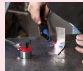
Mag-GC 300 pojemność 300 A