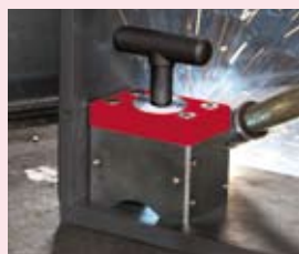
Mag-SQ 272 Siła odrywania 272 kg