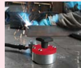
Mag-GC 600 pojemność 600 A