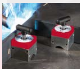
Mag-SQ 68 Siła odrywania 68 kg

Mag-SQ 450 Art. nr 4932352568 Kod EAN 4002395372263