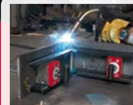
O dużej mocy, łatwe sterowanie

Mag-Angle 272 Art. nr 4932352570 Kod EAN 4002395372287