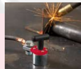
Mag-GC 200 pojemność 200 A