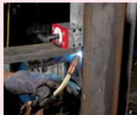
Mag-SQ 450 Siła odrywania 450 kg