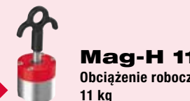
Mag-H 11 Obciążenie robocze: 11 kg