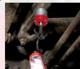
Mag-H 11 w akcji

Mag-H 18 Art. nr 4932352577 Kod EAN 4002395372355