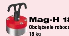
Mag-H 18 Obciążenie robocze: 18 kg