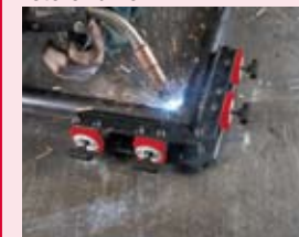
Kątowniki wewnętrzne / zewnętrzne