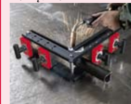
Przytrzymuje elementy płaskie i rury